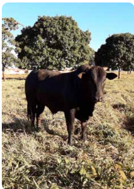
Animal inteiro mestiço, após suplementação com Minerthal Proteico 66

livre de todos os impostos. Isso significa que, para cada arroba engordada durante o período, houve um lucro de R$ 48,98; ou seja, R$ 233,63 por boi. Isso é um lucro de 37% sobre o capital investido – um retorno por investimento muito difícil de ser alcançado em qualquer outra atividade! Investir para crescer (e lucrar) é necessário. Porém, esse investimento não precisa significar manejos complexos e uma infinidade de produtos. Simplificar com apenas um produto de alta qualidade pode ser o caminho para o sucesso da sua produção. Fale com um técnico de nossa equipe e veja a melhor estratégia para o máximo ganho de sua atividade!