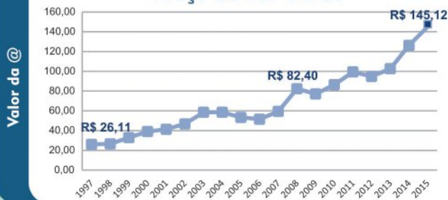
Preço do Boi Gordo